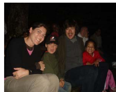
Feu de camp de fin de semaine des anciens