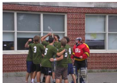
L'équipe de Kanawana à gagné!