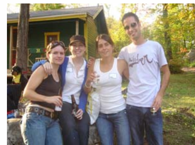
Anciens au présentation de développement

Pour obtenir une liste des participants ou plus de photos, visitez la section Nouvelles et événements des anciens sur notre site Web à www.ymcakanawana.com .